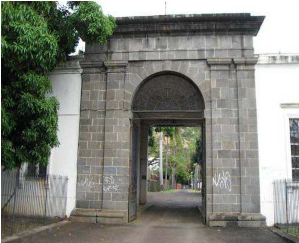
Entrée de l'école de Sages-Femmes sur le site de l'ancien hôpital colonial 95 rue Gibert des Molières à Saint-Denis