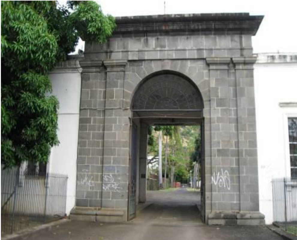
Porche d'accès à l'Ecole de Sages-Femmes sur le site du Camp Ozoux 95 rue Gibert des Molières à Saint-Denis